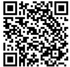
動画サイトQRコード

※ 携帯の場合は、QRコードを読み取ったサイトの一番下にある 「体育保健課学校体育班映像サイト」をクリックしてください。