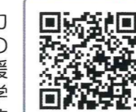
教育支援センター一覧

市町によって設置され、不登校児童生徒の基礎学力の充実、基本的生活習慣の改善等のための相談・支援（学習指導を含む）を、学校と協力して行っています。