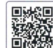
ひょうごっ子悩み相談