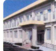
県立清水が丘学園