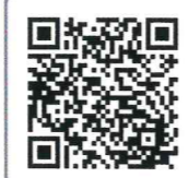
ほっとらいん相談