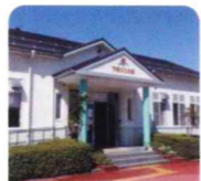
県立但馬やまびこの郷