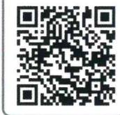
ひょうご不登校対策プロジェクト

県と市町が一緒になってスクールカウンセラーやスクールソーシャルワーカーなどの人材配置や不登校児童生徒への支援に関する研修や効果的な支援の検討を行っています。