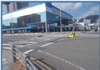
神戸 神戸市中央区 (HAT中央)