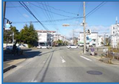
阪神北 宝塚市 (安倉南3丁目)