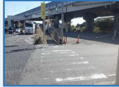
東播磨 高砂市 (高砂北ランプ)