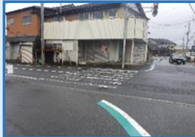
但馬 豊岡市 (九日市北)