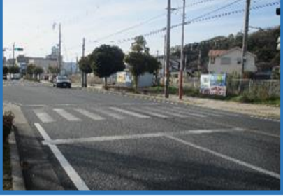
西播磨 赤穂市 (赤穂警察署東)