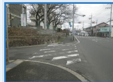
丹波 丹波篠山市 (下二階町)