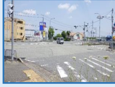
北播磨 三木市 (バイパス大村中央)