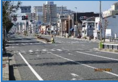
阪神南 芦屋市 (前田町交差点)