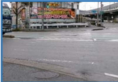
中播磨 姫路市 (中地ランプ)